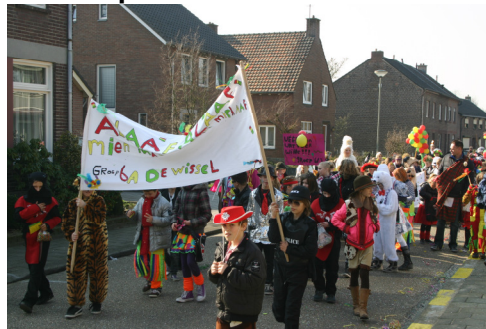
Goed weer en gezelligheid bij de kinderoptocht.